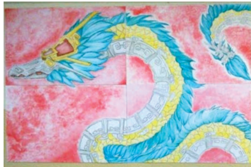
Trabajo colaborativo por alumnos del taller de artes plásticas ciclo 2016-1.