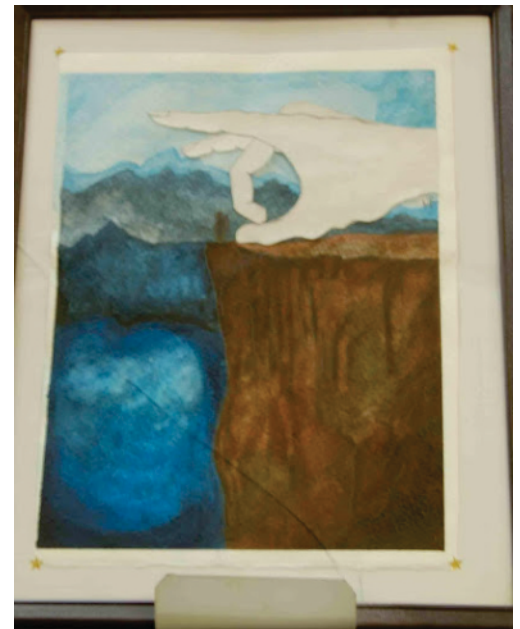
Productos de aprendizaje surrealismo.

Referente a la evaluación del aprendizaje asociado a la experiencia didáctica, mismo que requiere de una retroalimentación continua en el caso de las Artes Plásticas por su diseño instruccional. Al término del semestre escolar, se realizó una exposición en la Biblioteca del plantel en donde se exhibieron los trabajos; lo cual tiene como objetivo el fomentar la cultura y el arte en la comunidad; y a su vez, fomentar la seguridad para poder iniciar un cambio de percepción sobre sí mismo. Según la ocasión, se realizan actividades en donde se fomentan el trabajo en equipo y la cultura, donde los estudiantes tienen la oportunidad de expresarse libremente bajo ciertas directrices en donde se aplican los conocimientos adquiridos y su visión sobre el entorno, sociedad o algún tema específico.