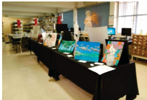
Exposición en la biblioteca "Ricardo Flores Magón", actividad de cierre del Taller de Artes Plásticas ciclo 2015-2.

En la fase de Cierre, al término, se procedió a la presentación de la obra concluida ante el grupo. En plenaria se les hicieron las siguientes preguntas: ¿Qué significado tiene la obra?, ¿Representa lo que el autor quiere expresar?, ¿Cómo se puede mejorar, desde el punto de vista técnico?. Estos cuestionamientos produjeron diversas reacciones, desde la total apertura a la crítica constructiva, hasta la falta de aceptación a las mismas. Sin embargo en todas las ocasiones los estudiantes mostraron respeto absoluto por cada una de las obras, reconocieron la necesidad de mejorar tanto las habilidades propias como las técnicas que han puesto en práctica. Como se muestra en las siguientes evidencias fotográficas: